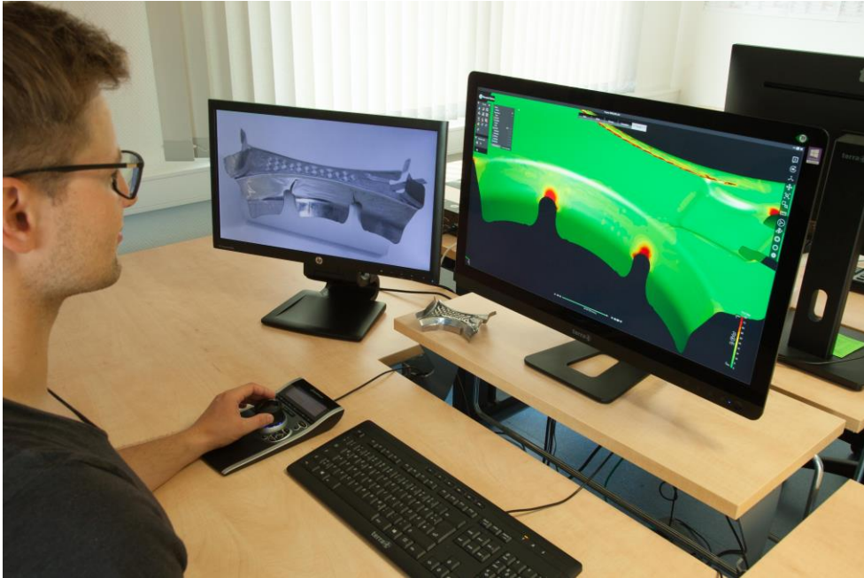
Stampack Xpress: Volumensimulation und benutzerfreundliche Oberfläche liefern schnell exakte Ergebnisse für Machbarkeit und Oberflächengüte.